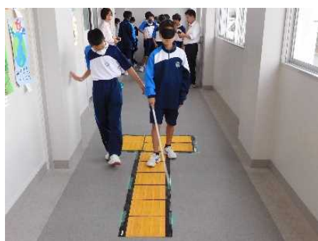
【点字ブロック体験の様子】

生徒はバリアフリーに関するクイズを楽しんだり、知らなかったことに驚いたりしながら授業を受けている様子で、バリアフリーについて考えるよいきっかけとなったように思います。