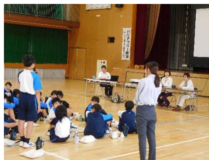
【榎さんへ質問する様子】

交通みらい室では、今後も様々な取り組みにより、「心のバリアフリー」の推進を図っていきます。