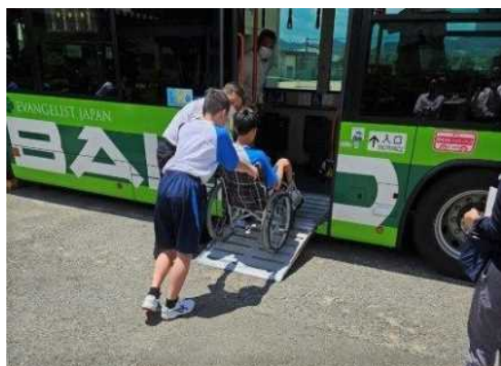
【バス乗降体験の様子】