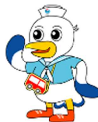
神戸運輸監理部マスコットキャラクター「こうべえ」

今月は、帆船日本丸が神戸港に1 か月近く停泊していたので、ご覧に なられた方も多いのではないでしょ うか。船っていいですね。