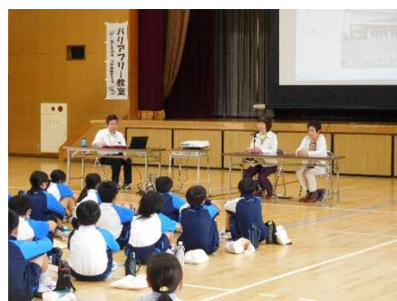
【榎さんのお話の様子】

「ドイツでは障害を『個性』として捉える人が多く、困っている人を自然と助ける習慣がある」、「日本は道路や施設等のハード面のバリアフリーはとても優れているが、心のバリアフリーはドイツの方が大きく前進している」と話されていたことが印象的で、日本のバリアフリーに足りない部分について知ることができました。