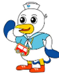
神戸運輸監理部マスコットキャラクター「こうべえ」