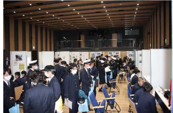
【2階会場は、通路いっぱいに参加者が！】

今回の開催は、船員の高齢化や将来の人手不足を見越した海運事業者から、当初の募集枠38社を大きく上回る76社の応募がありました。抽選で全国各地から52事業者が出展し、海技者セミナーに初参加の事業者もあり、セミナーへの注目度の高さを伺い知ることが出来ました。