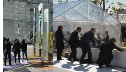
カリヨンの鐘と献花の様子

一方、神戸の希望を象徴する行事としてコロナ禍前までは12月に行われていた「神戸ルミナリエ」が、4年ぶりに開催時期を1月に変更して開催されました。今回は、東遊園地、旧外国人居留地、メリケンパークと、エリアを分けた作品展示が行われ、大きな混雑はなく、ゆっくり鑑賞することができました。メリケンパークは、有料エリアでしたが、夜の神戸港の夜景を見ることができ、二重に楽しめました。