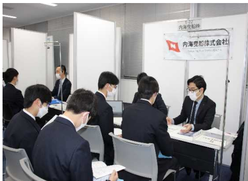
【5階会場からも、熱気が伝わります！】

参加者は、神戸港に寄港中の(独)海技教育機構の練習船「銀河丸」「青雲丸」で乗船実習中の海上技術短期大学校や商船高等専門学校の実習生、海技大学校の学生、水産高校の生徒のほか、船員未経験の方を含む一般求職者など合計で256名の参加がありました。