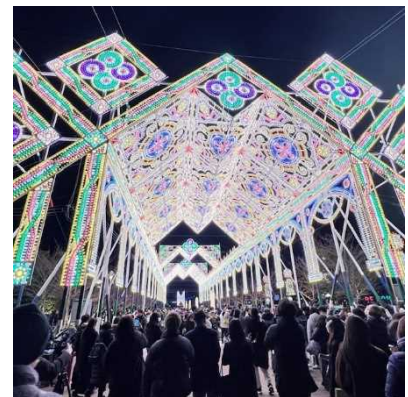
メリケンパークのルミナリエ

一方、神戸の希望を象徴する行事としてコロナ禍前までは12月に行われていた「神戸ルミナリエ」が、4年ぶりに開催時期を1月に変更して開催されました。今回は、東遊園地、旧外国人居留地、メリケンパークと、エリアを分けた作品展示が行われ、大きな混雑はなく、ゆっくり鑑賞することができました。メリケンパークは、有料エリアでしたが、夜の神戸港の夜景を見ることができ、二重に楽しめました。