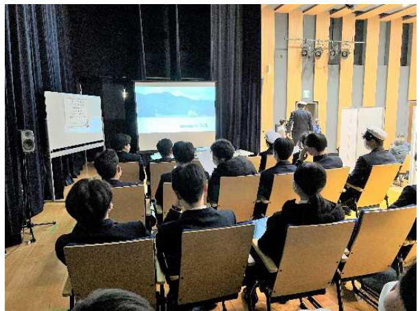
【ブース訪問の合間も、企業PRビデオで情報収集】

今回の「めざせ！海技者セミナー IN KOBE」では全国初の試みとして、残念ながら本セミナーに出展できなかった落選事業者向けの取組を2点実施しました。一つ目は、落選事業者のPRビデオを放映するコーナーの設置です。落選事業者には10分以内の自社PRの動画を製作していただき、会場にて放映した所、いつも座席が埋まるほど視聴していただくことができました。