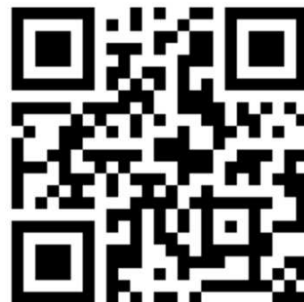
神戸運輸監理部公式X