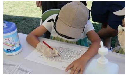
【視覚障害者疑似体験の様子】

「視覚障害者疑似体験」では、目が見えにくくなるゴーグル等を着用していただいた上で、文字を書いたり、迷路をしたりしていただきました。普段と見え方が異なることを体感し、視覚障害についての理解を深めることができました。