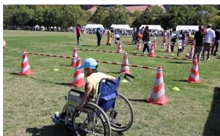
【車いす自走・介助体験の様子】

「車いす自走・介助体験」では、車いすの基本的な操作方法、介助時の注意点などを職員が説明した後、実際に体験していただくことで車いすの安全な使い方や困っている利用者への介助方法等について理解を深めることができました。