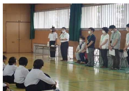
【バリアフリー教室の様子】

今回は、令和4年9月6日（火）と9月27日（火）に、姫路市立神南中学校において、1年生57名を対象にバリアフリー教室を開催しました。バリアフリー教室は二日に分けて行われ、一日目は座学、二日目は車いす自走・介助体験、視覚障害者疑似・介助体験、ノンステップバスの乗降体験などの体験学習を行いました。