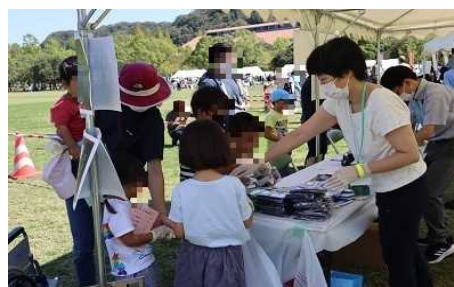
【「こうべ福祉・健康フェア」の様子】

当日は、「車いす自走・介助体験」、「視覚障害者疑似体験」を行い、子供連れを中心に約200名の方々にご参加いただきました。体験によっては順番待ちになるものもあり、大盛況のイベントとなりました。