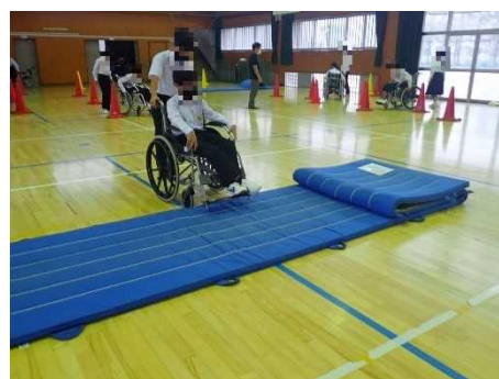
【車いす自走・介助体験の様子】

車いす自走・介助体験では、監理部のスタッフが操作方法や声かけの重要性を説明した後、生徒が2人1組となり、実際に車いすに乗って、自走体験と介助体験を行いました。自走でコーンの間を進んだり、介助付きで段差を乗り越えたりしました。体験を通して、車いすの人が狭い道を進みにくいこと、段差がある施設は利用しづらいことについて理解を深めました。