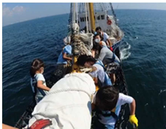
バウスプリット渡りの様子

最初に帆を張る作業を体験したあと、子供たちは各班に分かれて、バウスプリット（船の先）渡り、操船などを体験したほか、「みらいへ」の船内教室において、ミニ出前授業を開催し、海洋・海運の重要性について理解を深めてもらえるよう、船の役割や船員の仕事について受講していただきました。そして入港前に帆を畳む作業を行い、乗船体験を終了しました。