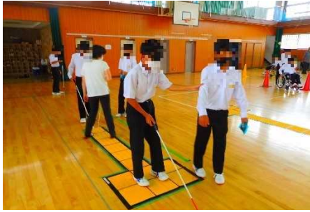
【視覚障害者疑似・介助体験の様子】

視覚障害者疑似・介助体験では、アイマスクと白杖を用いて、点字ブロックや介助の有無による歩行しやすさの違いを体験し、点字ブロックや介助の必要性を体感しました。また、視覚障害の当事者の方との交流会も実施し、生徒たちはお話に真剣に耳を傾けていました。