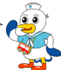
神戸運輸監理部マスコットキャラクター「こうべえ」

来る7月23日は、海の恩恵に感謝し、海洋国日本の繁栄を願う国民の祝日「海の日」です！